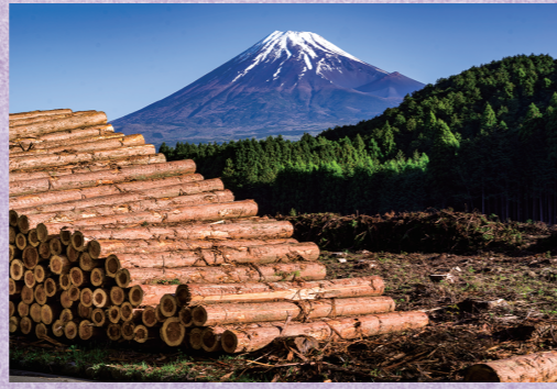
平井 敏夫 『ひのきの森に朝日が照らす』