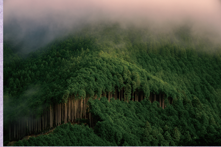
浅井 貴章『森林の目覚め』