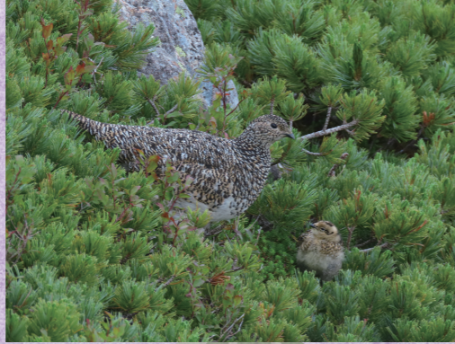
阪本 森人 『ライチヨウウの親子』