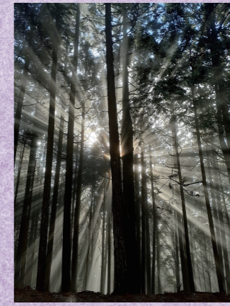
半田 光志 『木立と朝靄と太陽と』