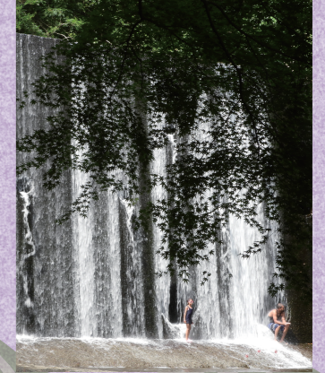
望月 正晴 『涼を求めて』