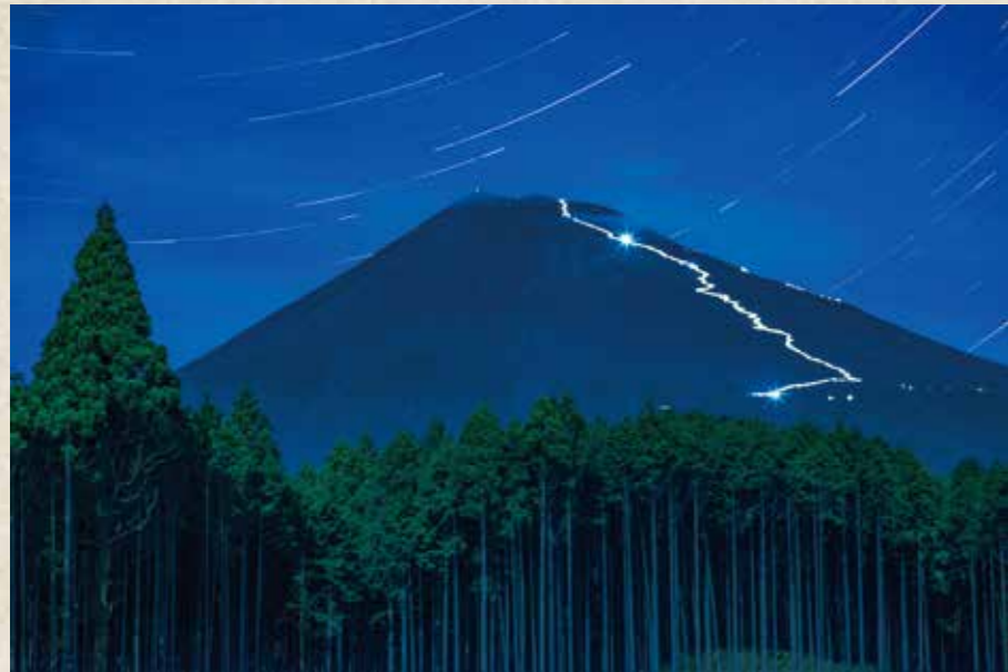
平井敏夫「富士ひのきと登山道」