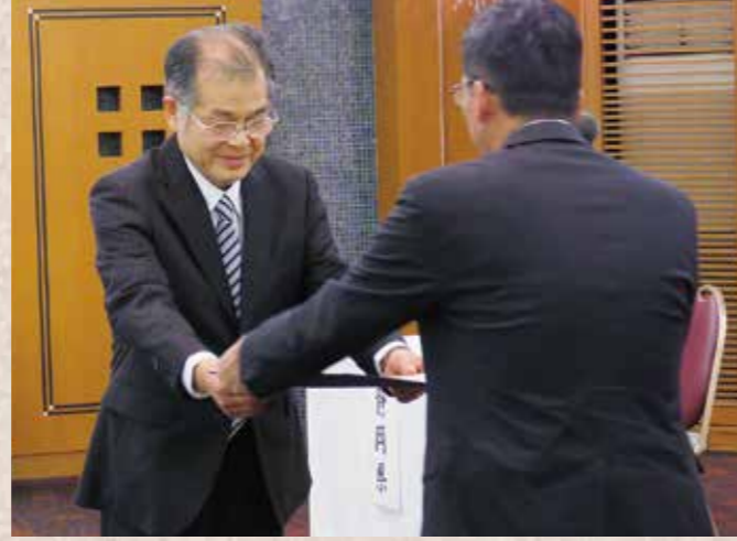
令和元年度表彰式

【主催】公益社団法人 静岡県山林協会 【協賛】公益財団法人 静岡県グリーンバンク 【後援】静岡県、静岡県教育委員会、静岡新聞社・静岡放送、中日新聞東海本社、静岡県写真材料商組合